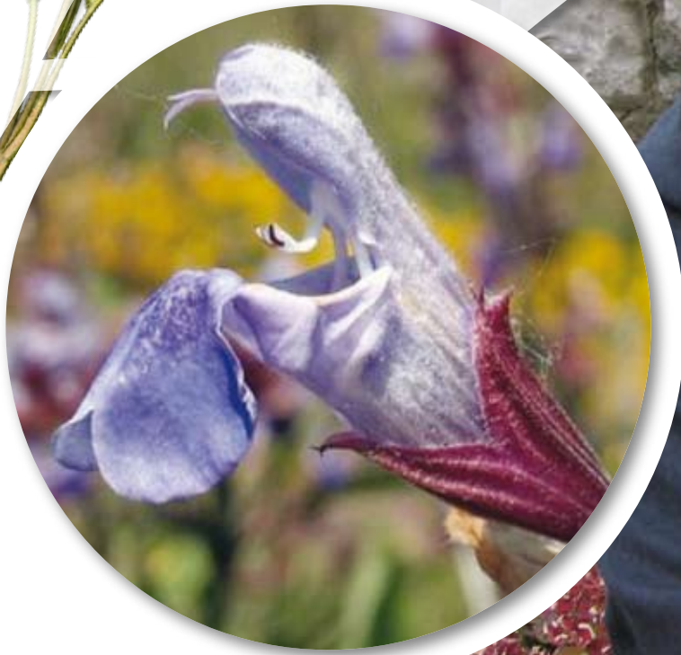
Salvia officinalis Salvia - Salvija - Žajbelj

S salvijo an maslam se lahko obiel puno jedil an je zlo petikno. Salvijo pa se jo nuca ne samuo za naparavt jedila, pa tudi za se zdravit. Pomaga posebno plucjam, kier potalaze kašij an odpre nuos: pokuhi no malo salvije tu mliece, če se ga upaš popit! Stor dobro za ozdravet bronkito ali pljučnico (polmonito). Če povečeš perja od salvije, zobje ti ratajo buj bieli.