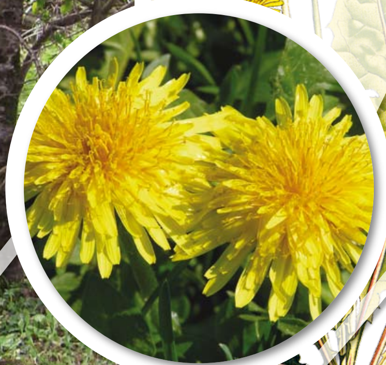
Taraxacum officinale Tarassaco - Modac - Regrat

Modac je prú dobar v solat al pa kuhan, obiejan s puno ocvierkmi mastnega sadla. Ocvarito se lahko jje tudi cvetje, umiešano z icàm an moko. Modac diela dobro žuotu an posebno tistim, ki imajo jetra bune al pa žuč, kjer sfreška an vežene uodò, ki žuot previc pardaža. Kajšjan mojstar napravja z modacam tud marmelado an modacove vino.