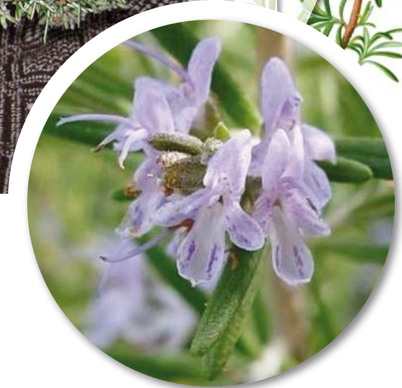
Rosmarinus officinalis Rosmarino - Rožmarin - Rožmarin

Pušjac ti rada nardim, ist ložem nagul an ti rožmarin