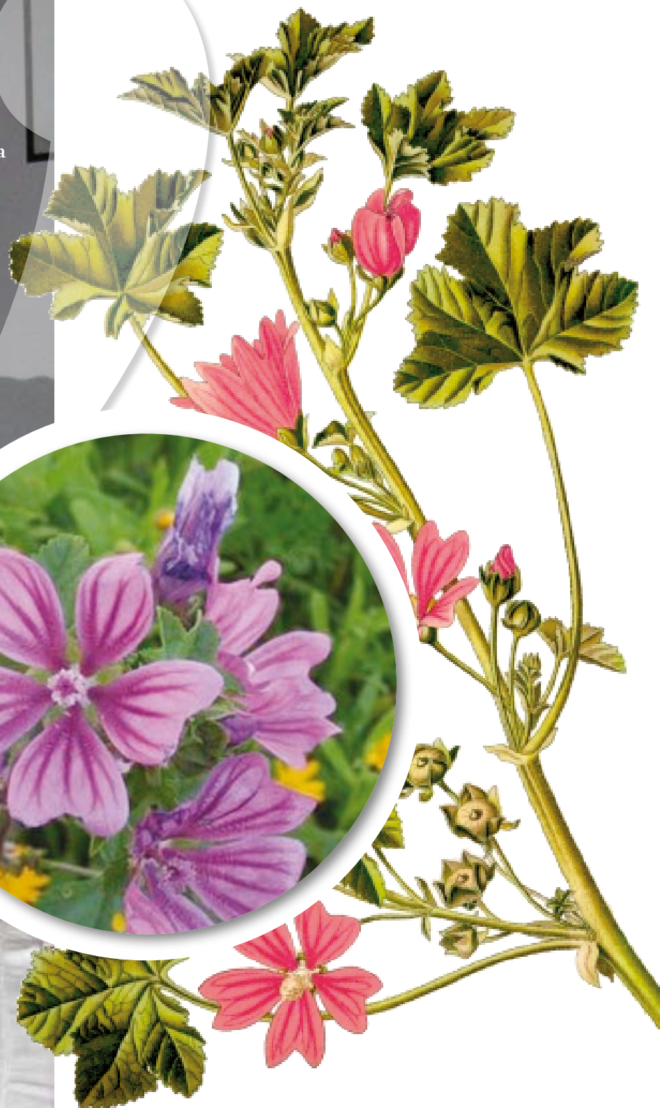
Malva sylvestris Malva - Slis - Slezenevec

Po navadi se nuca slisove cvetje, pa tudi perja nam morejo pomat. čaj je dobar za pregnat hud kašij an katar. More pomat tud za očistit čerieva, kar se čuješ napet trebuh. Če se ga nuca previc, škoduje ledvicam (reni) an tudi altvane nie pru, de ga pijejo.