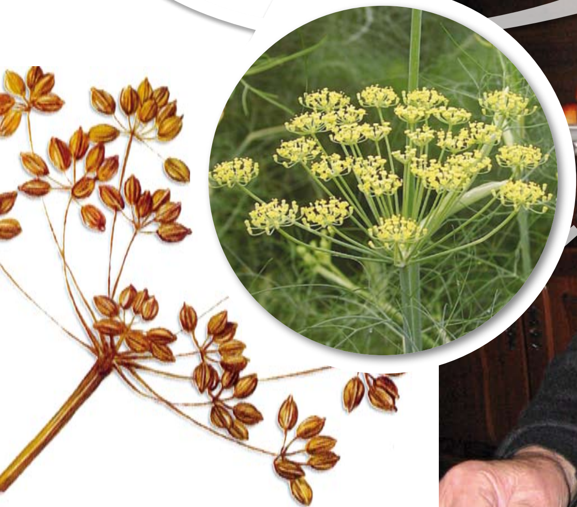
Foeniculum vulgare Finocchio - Komarač - Komarček

Komarač pomaga narvic želodcu an čerjevam. Se lahko nuca cvetje pa tudi sienje. An je pru sienje, ki pomaga za dat dobar saur jedilam: ga parložemo mesu pa tudi gobam, burjam al pa če kuhamo kake čudne župe. Tud kruh je posebno sauritan, če v testuo smo dodal no malo komarača. Čebula komaračova se lahko jie saruova al pa kuhana. Kajšan klade komarač tu vino, za de rata buj sladkuo.